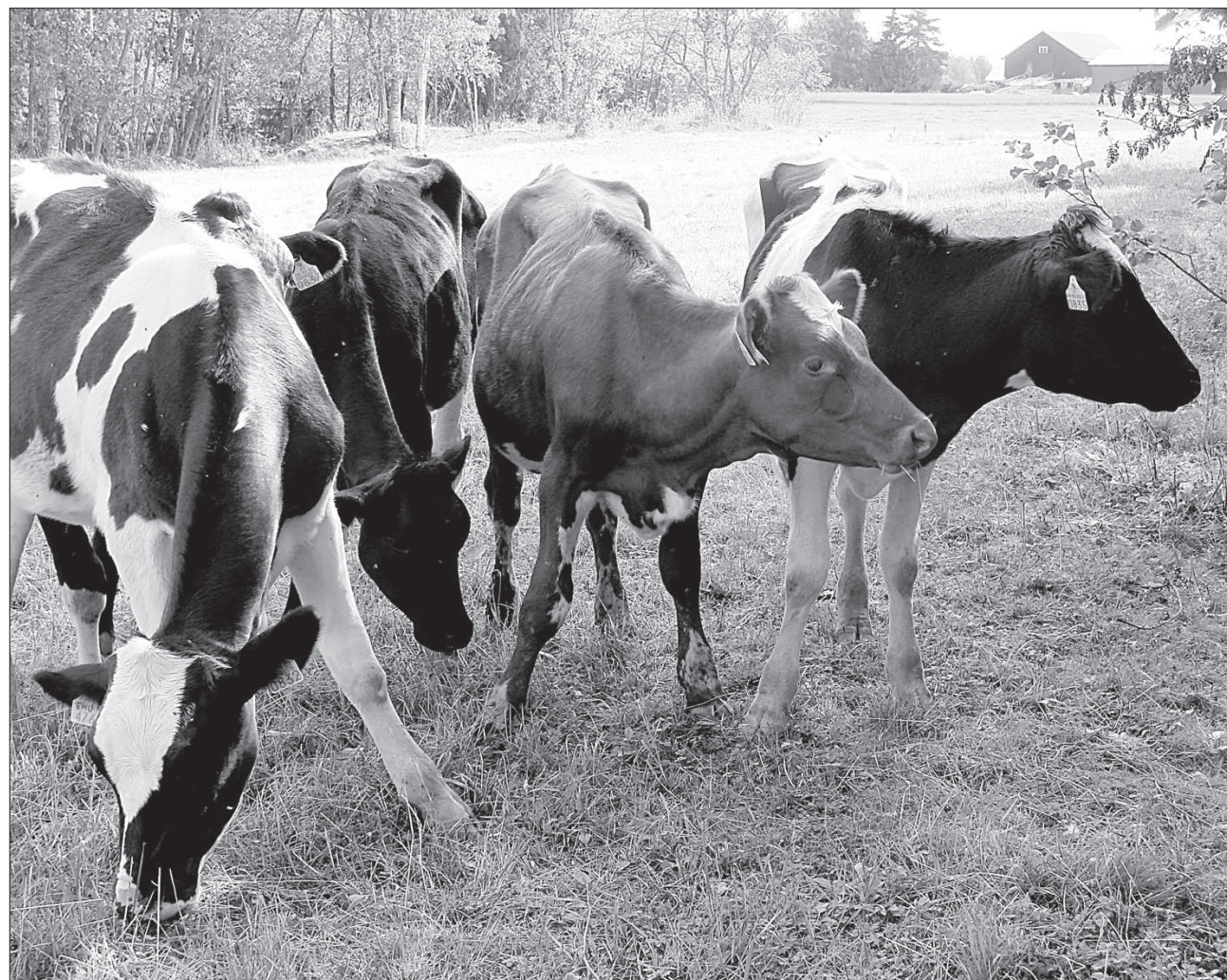
Tilan nuoret hiehot kuuntelivat korvat höröllä, mitä heidän kesälaitumelleen kaavailtiin ja minkälainen urakka heillä olisi sen hoidossa.

Kun vanha hakamaa näin saa valoa, maaperän siemenpankki herää eloon, ja vanhat, sille tyypilliset kasvit lähtevät kasvuun. Kun syötävää kertyy, myös karja innostuu liikkumaan alueella paremmin ja kunnostaa samalla hakaa.